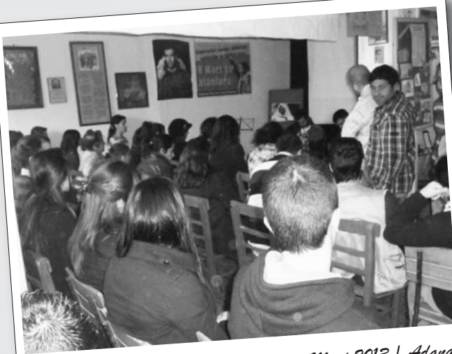
3 Mart 2013 | Adana

Küçükçekmece BDSP, 8 Mart etkinliğini gerçekleştirdi. Devrim ve sosyalizm mücadelesinde yitirilenler için bir dakikalık saygı duruşunun ardından 8 Mart'ın tarihi üzerine kısa bir anlatım yapıldı. Sunumu "Kapitalizmde kadın sorunu ve kadınların güncel talepleri" isimli sinevizyon