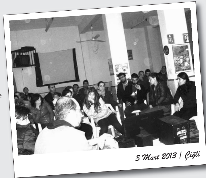
3 Mart 2013 | Çiğli

gösterimi izledi. Sinevizyon gösteriminin ardından da 8 Mart'ın güncel çağrısı üzerine BDSP konuşması gerçekleştirildi.